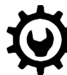
実用新案 Utility model

物や建物、画像などの商品・製品デザ インについて、一定期間、独占排他的 に実施できる権利